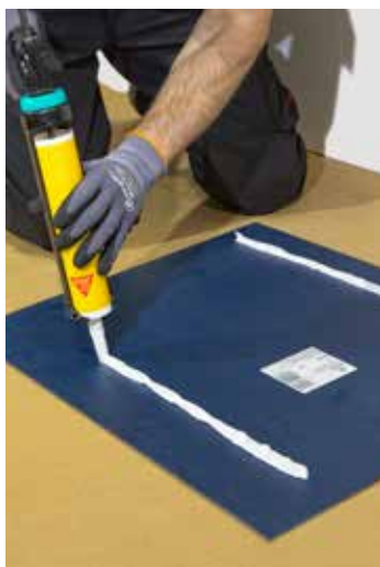
Sterke en elastische verlijming

Goede hechting op beton, mortel, natuursteen, glas, spiegels, keramiek, hout en metalen