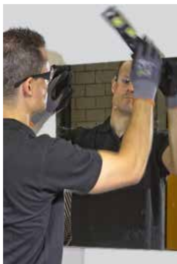
Geen tijdelijke mechanische bevestiging nodig

Montage met elastische lijmen maakt uw werk eenvoudiger, veiliger, sneller en de hechting is langdurig. Elastische lijmkitten kunnen oneffen oppervlakken overbruggen, spanning en trillingen absorberen.