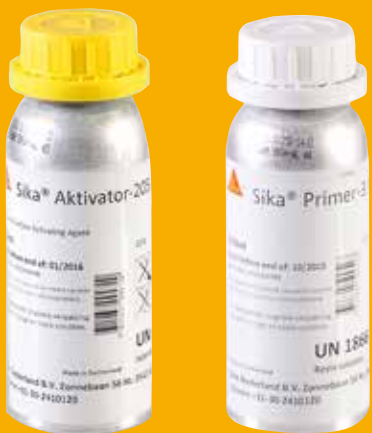
Sika® Aktivator-205 Sika® Primer-3 N